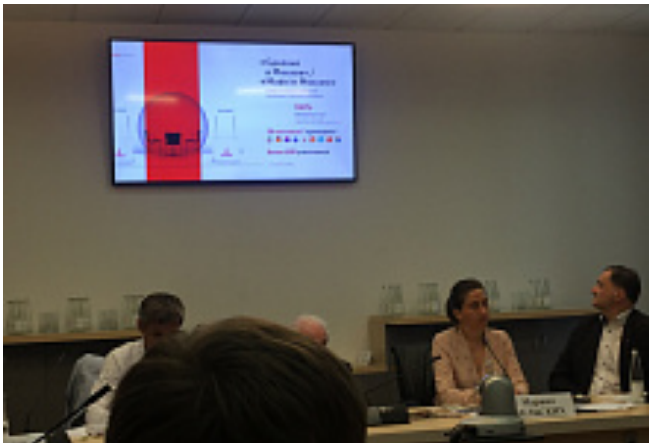
Канада (/tags/?tags=Канада), ТПП РФ (/tags/?tags=ТПП РФ), Союз Женских Сил (/tags/?tags=Союз Женских Сил),