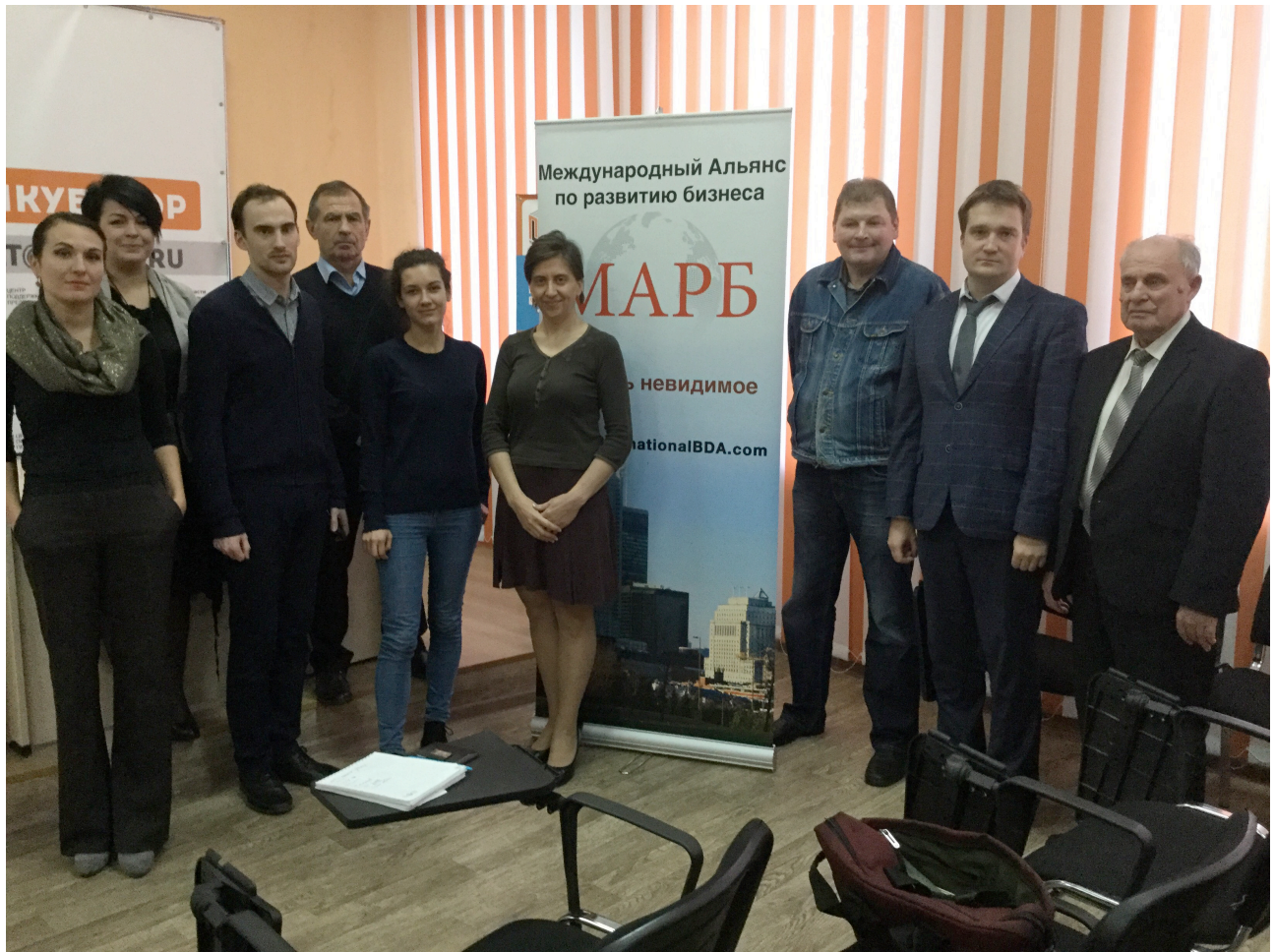
На фотографии коллектив Центра поддержки экспорта Тульской области со спикером мероприятия.