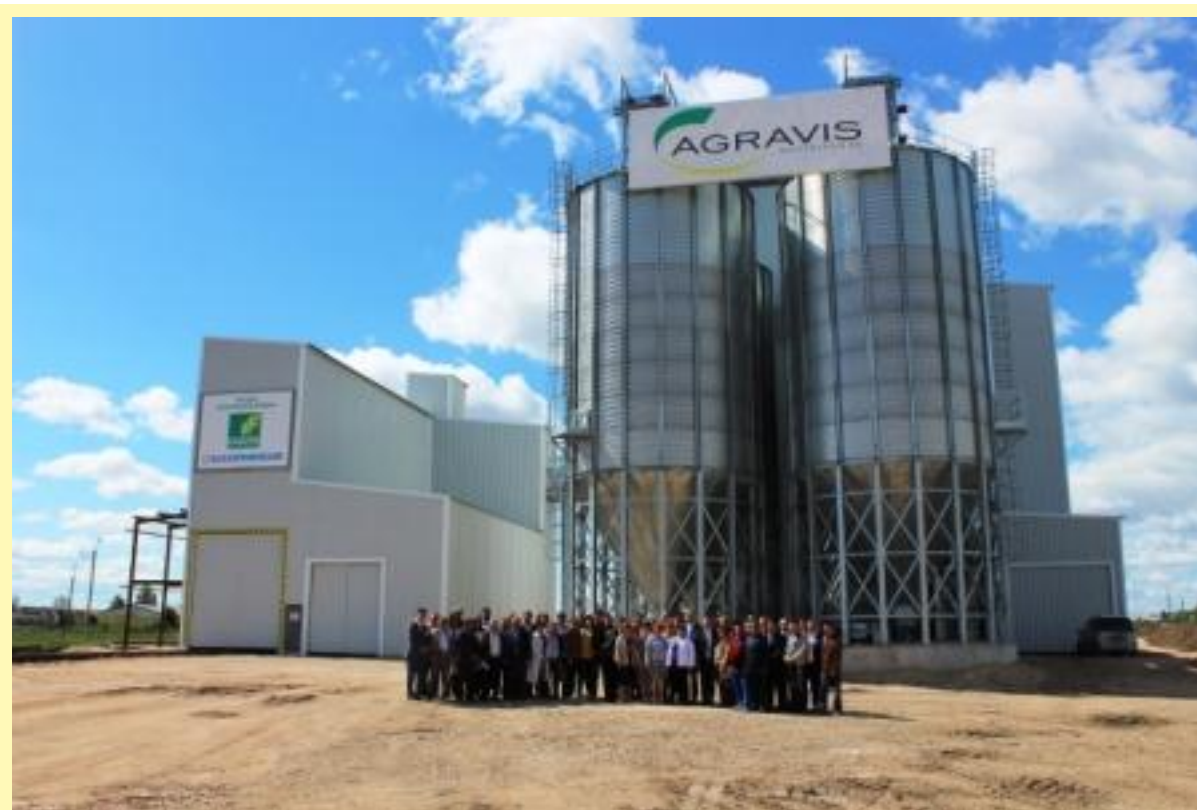
Участники Дня открытых дверей, посвященного запуску производства нового комбикормового завода AGRAVIS